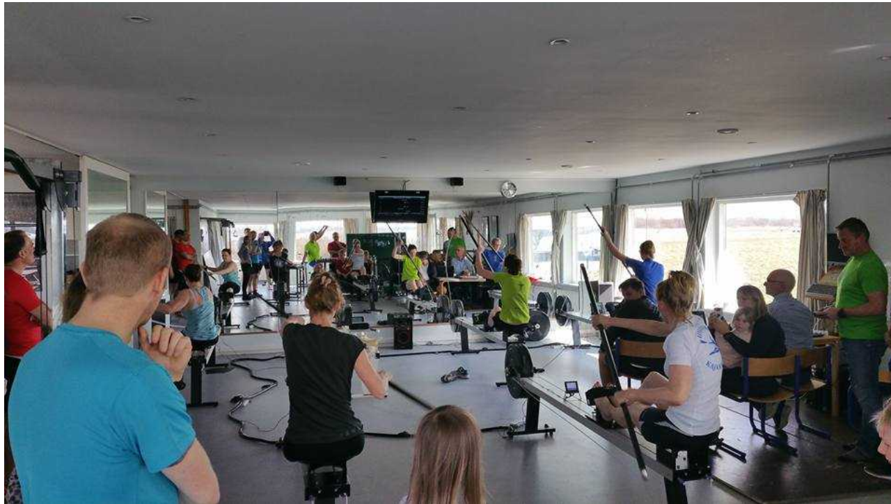
Hektisk aktivitet i træningslokalet

Træningen er en fantastisk mulighed for alle roere, eftersom roteknik trænes og formen holdes ved lige i vinterperioden. Det er også en god social aktivitet, da nye roere har mulighed for at møde andre medlemmer i løbet af vinteren, hvor klubben er lidt mere stille end om sommeren. Træningen er organiseret på bedste vis, og det opleves generelt at træningstider bliver revet væk af andre medlemmer ved afbud.