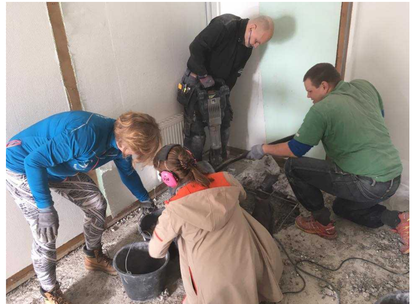
Renovering af omklædning mm.

Vores sauna blev nedlagt for at give plads til at udvide kvindernes omklædningsrum, og både herrernes og damernes omklædningsrum er ved denne lejlighed blevet renoveret. Senest er der installeret nye toiletter.