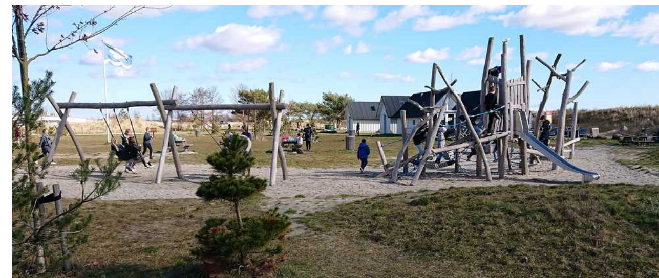
Legeplads i grønne omgivelser - her fra Ishøj Strand

Vi opfordrer til, at kompetente personer med den rette uddannelse udarbejder en helhedsplan for, hvordan havneområdet / Kystagerparken kan opgraderes til gavn for borgerne ud fra de ideer, der er kommet frem på Idrætsrådets møder vedrørende havnens udvikling.