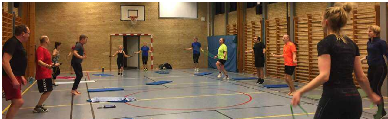
Vintergymnastik på Langhøjskolen

Den nuværende formand blev medlem af klubben i 1968, og han kan fortælle, at vi har igennem alle årene haft vintergymnastik – på nær denne vintersæson, da vi har måttet aflyse på grund af manglende træner, og i øvrigt har opprioriteret ergometertræningen med kompetent instruktør – faktisk den person, der har konstrueret ergometrene. Men det er absolut vores håb, at dette tilbud også skal være gældende fremover, og at vi kan benytte Langhøjskolen som tidligere tirsdag aften. Det er en vigtig aktivitet, da den er med til at samle medlemmerne om vinteren.