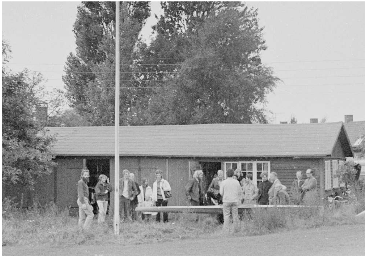
Hvk i slutningen af 60'erne

Klubben har rødder tilbage til 1927, og har været placeret forskellige steder. Hvidovre Kajakklub er nu beliggende langs med nordre mole. Denne placering har eksisteret siden 1976, da den daværende klub ikke længere var tidssvarende, idet der hverken var indlagt elektricitet eller vand, og toilettet kun var et skur med en spand i - og huset var i øvrigt faldefærdigt.